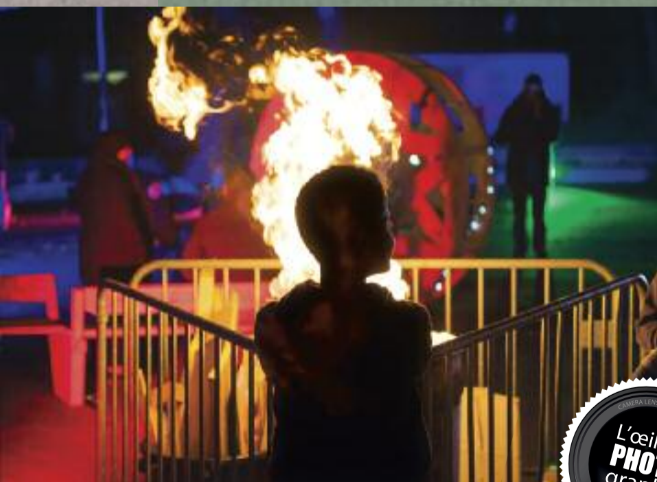
Le Mas s'illumine, le 16 décembre à Malval.

L'annonce n'a pas été faite de façon officielle, mais quatre nouvelles enseignes arriveront au Carré de Soie avant la fin du premier semestre 2017, en complément d'une grande surface alimentaire. Depuis quelques mois, le pôle commercial connaît un nouveau souffle avec l'arrivée de l'Appart, l'extension de Boulanger et la venue du magasin d'usine Nike et de Mini World Lyon, le parc d'attraction de miniatures.